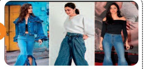
ऑफिस में बेल बॉटम जींस...