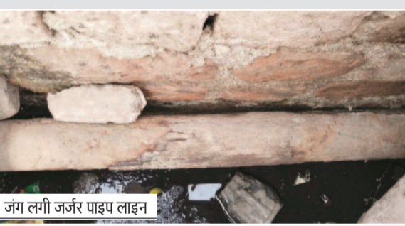
जंग लगी जर्जर पाइप लाइन

हरिभूमि न्यूज ►►मिलाई भिलाई-चरोदा क्षेत्र के वार्ड 8 में पेयजल व्यवस्था बर्दाहल हो चुकी है। यहाँ वर्षों पुरानी पाइपलाइन अब पूरी तरह जर्जर हो गई है। कई जगह से पाइप फट चुके हैं और लगातार